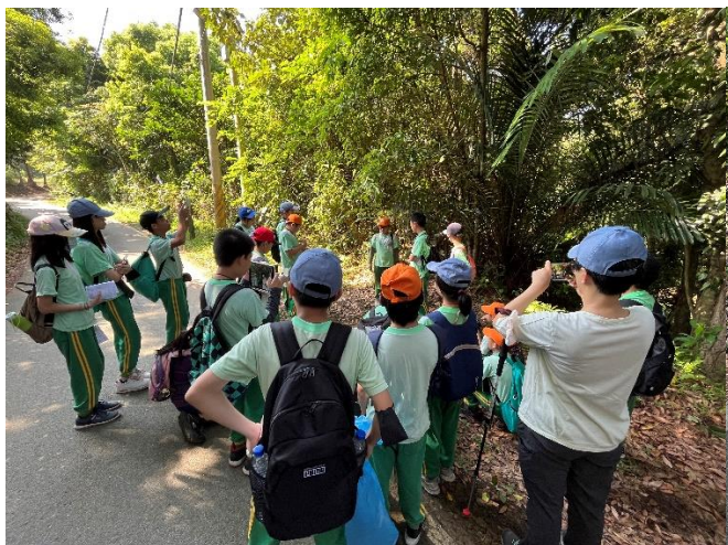
學生在大芫芎「執行戶外生態解說任務」