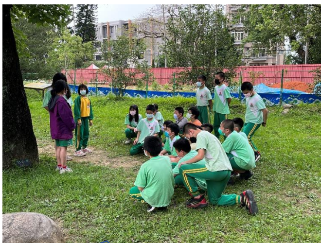
老師分配「生態解說任務」，學生在校先行練習