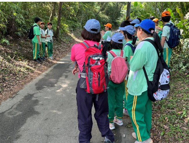
王校長也親自參與本次「戶外教育」觀課，聆聽孩子們的生態導覽。