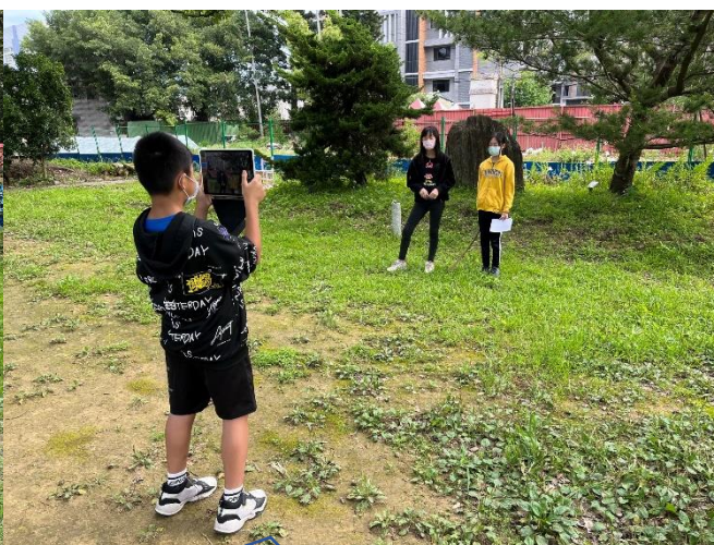
學生用平板錄製說說效果，回放檢討後再練習，不斷修正與練習」